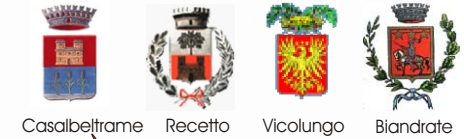
Casalbeltrame Recetto Vicolungo Biandrate