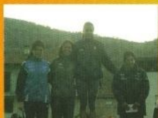
Podio Femminile 2009