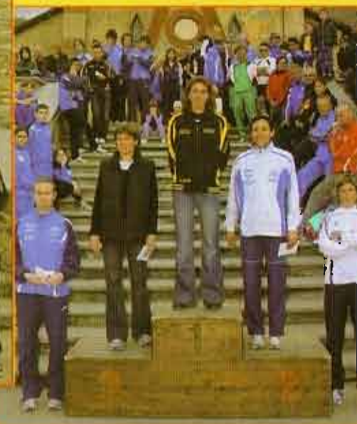
Podio maschile e femminile 2010