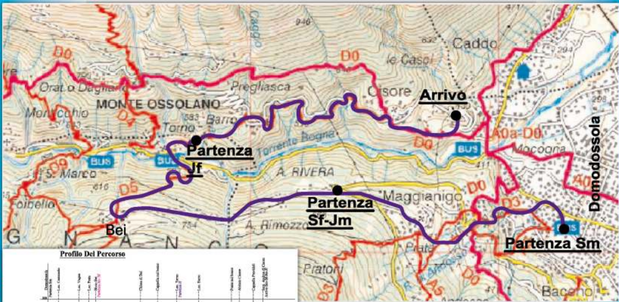
Profilo Del Percorso