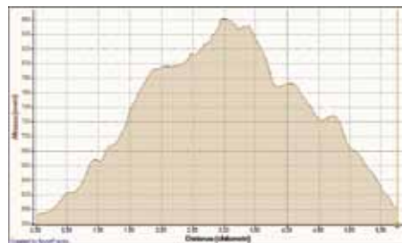
1ª Frazione Percorso e Altimetria