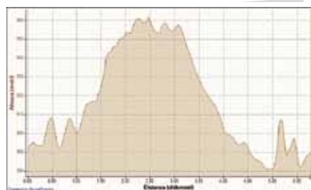
2ª Frazione Percorso e Altimetria