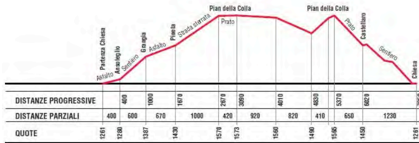
staffetta maschile 3 x 7250 m